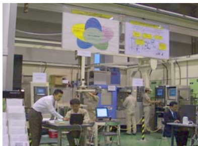
模擬工場での実験