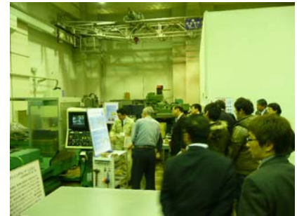
当所 研修実習室と加工実験室を利用したセミナー